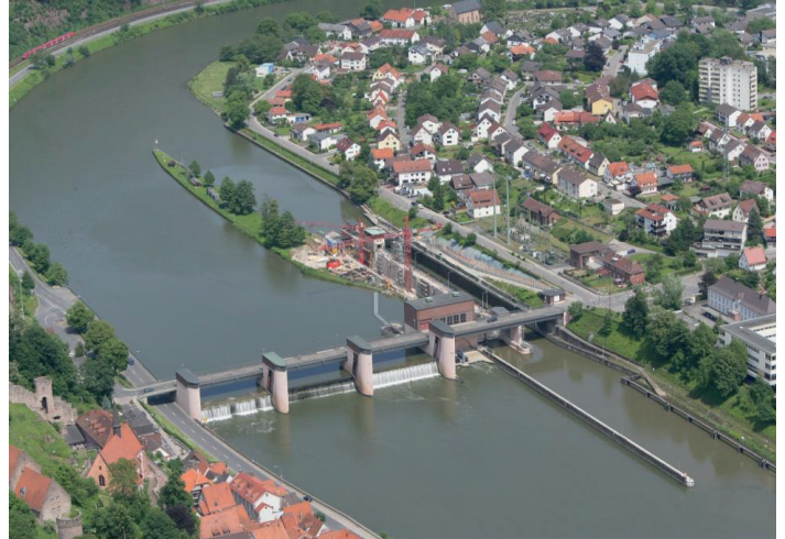
Luftbild der Schleuse Hirschhorn

Das Angebot ist geeignet für die Klassenstufen 4 bis 13 und kann auf Wunsch auch an den Schleusen Neckarsteinach und Rockenau durchgeführt werden.